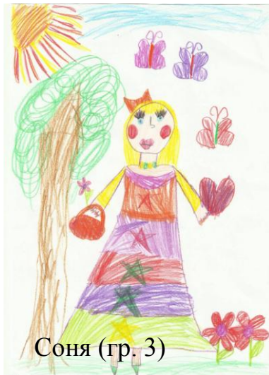
Соня (гр. 3)