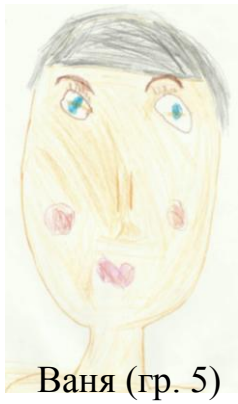
Ваня (гр. 5)