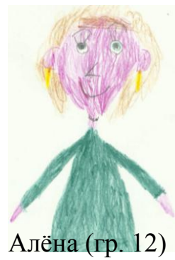
Алёна (гр. 12)