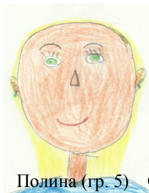
Полина (гр. 5)