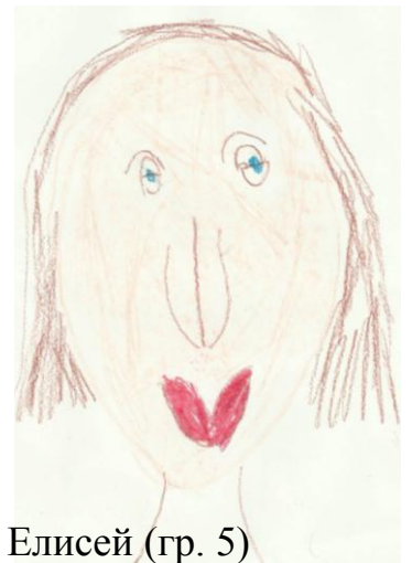
Елисей (гр. 5)