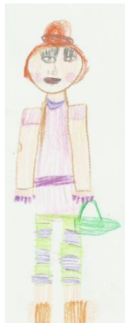
Лиза (гр. 3)